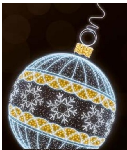
bombka 3 D 2m