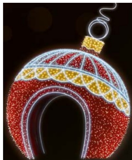
bombka 3D 5m