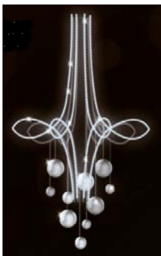
dekoracja nasłupowa - 5 szt.

Wykonawca zobowiązany jest do wykonania dekoracji świątecznej miasta w terminie do 4 grudnia 2022 i utrzymywania jej w stałej sprawności technicznej do dnia 10 stycznia 2023 włącznie. Dekoracja wielkanocna – ramka i zajączek powinna być zamontowana na placu Wolności w poniedziałek wielkiego tygodnia i zdemontowana w poniedziałek po świątach Wielkiej Nocy.