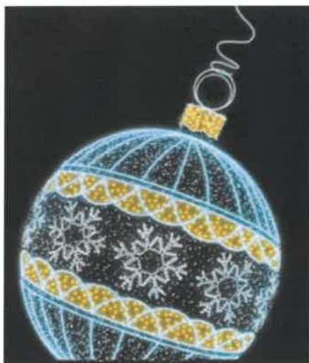
bombka 3 D 2m