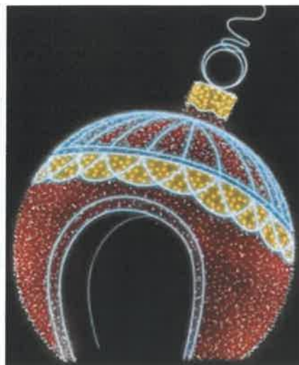
bombka 3D 5m